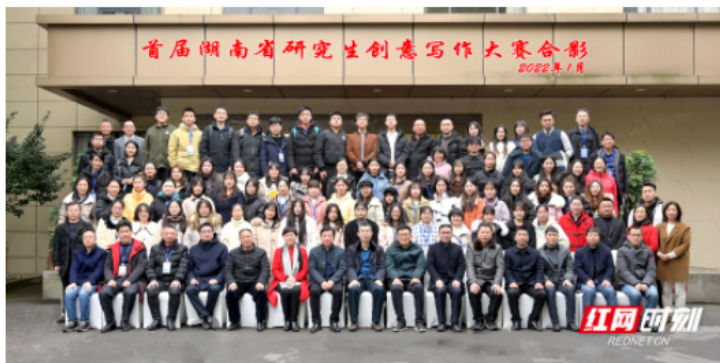
首届湖南省研究生创意写作大赛举行。

在2022年1月举行的首届湖南省研究生创意写作大赛中，来自15所高校72名选手同台较量，用实力斩获荣誉，以奋斗诠释青春。评委是湖南省作协副主席闫真、汤素兰等业内大咖。