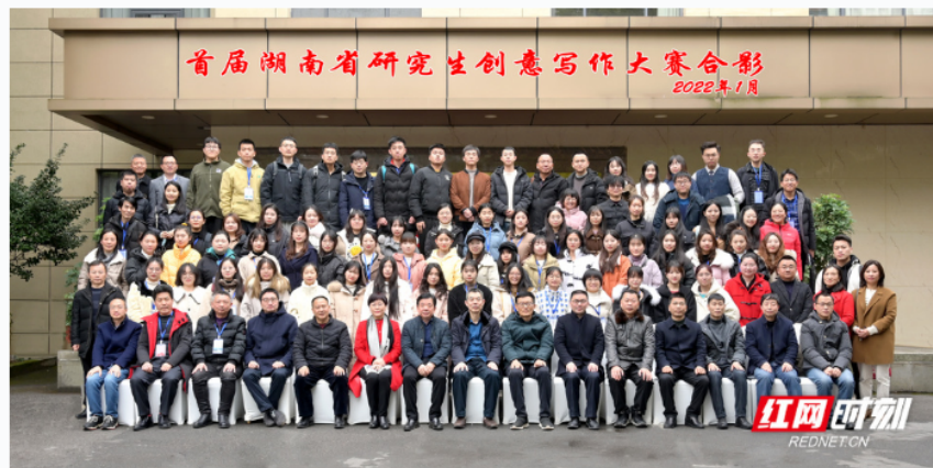
首届湖南省研究生创意写作大赛举行。

在2022年1月举行的首届湖南省研究生创意写作大赛中，来自15所高校72名选手同台较量，用实力斩获荣誉，以奋斗诠释青春。评委是湖南省作协副主席闫真、汤素兰等业内大咖。